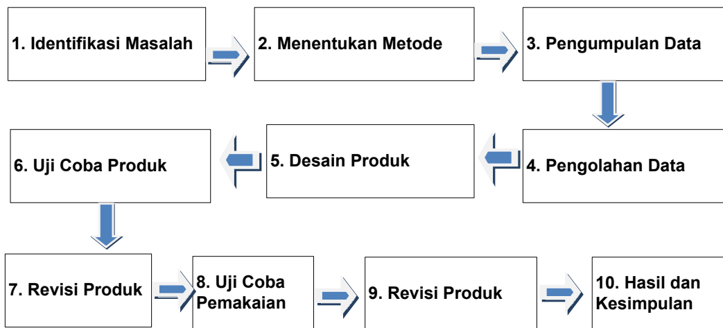
Gambar 3.3 Prosedur Pengembangan

Prosedur pengembangan merupakan langkah-langkah dari proses pengembangan yang dilakukan. Prosedur pengembangan dalam penelitian yang akan dilakukan mengacu pada teori sugiono dan dapat digambarkan pada gambar berikut: