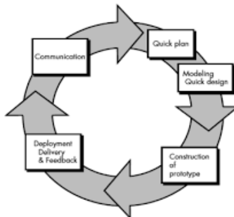
Gambar 2. 2 Model Prototype (sumber : Pressman. Roger,2012,p.51)

Menurut Presman dan Roger (2012,p.51) Model pengembangan adalah dasar dari sebuah produk untuk mendapatkan hasil yang diharapkan yang terdiri dari dua jenis yaitu evolusi dan persyaratan., Model evolusi bersifat iterative yang dicirikan dengan bentuk yang memungkinkan untuk pengembangan perangkat lunak yang semakin kompleks pada versi berikutnya., Model prototype ini dimulai dengan pengumpulan kebutuhan pengguna. Lalu membuat sebuah rancangan kilat yang selanjutnya akan dievaluasi kembali sebelum melalui proses produksi., Prototype merupakan rancangan yang perlu dievaluasi dan di modifikasi Kembali dengan versi yang lebih kompleks. Berikut ditampilkan gambar model protyep